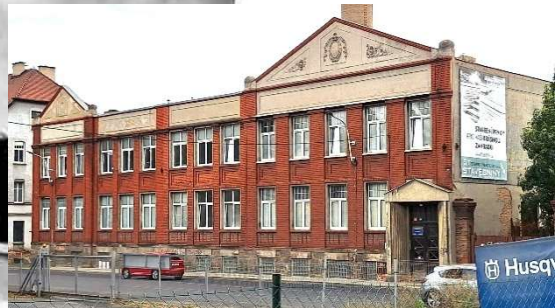
Arbeiterdruckerei in Bodenbach