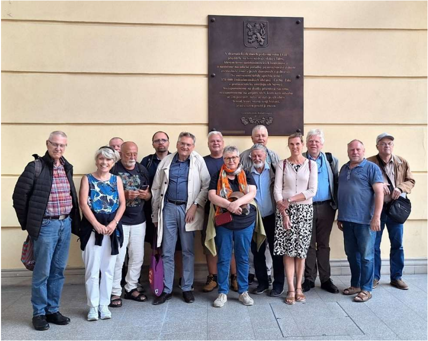
Am Masaryk-Bahnhof erinnert die Gedenktafel an die Tschechen, Juden und deutschen Antifaschisten erinnert, die 1938 von den Nazis aus den tschechoslowakischen Grenzgebieten vertrieben wurden.