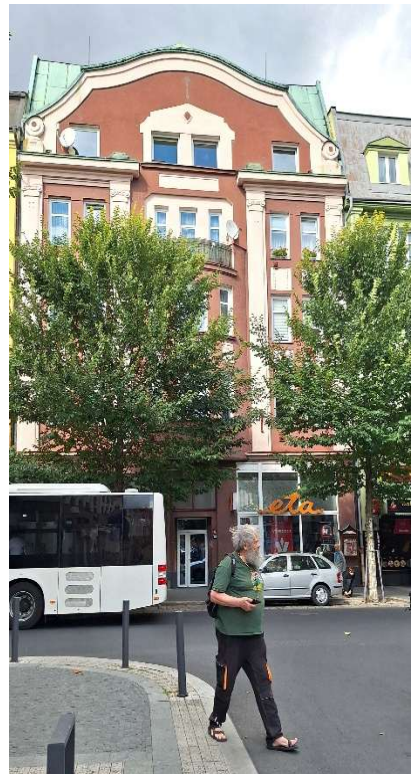
Das Zentralgebäude der Konsumgenossenschaft Bodenbach beherbergte auch die Volksbuchhandlung des Genossen Kögler, die Redaktion des Nordböhmisches Volksboten und einen Konsumladen.