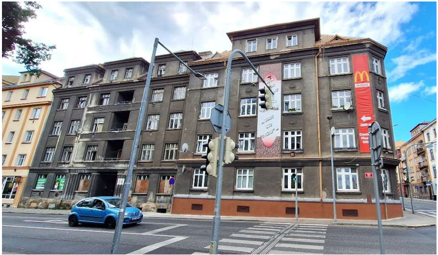
Immobilien der Wohnungsbaugenossenschaft Bodenbach: Victor-Adler-Haus und Karl-Cermak-Haus – die Gebäude heute