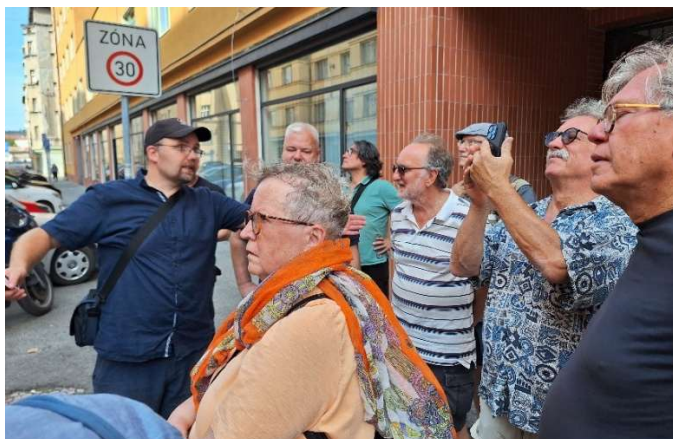
Unser Ziel: Land, Leute und Geschichte kennenlernen mit der Seliger-Gemeinde (Foto zeigt die Teilnehmer der Studienfahrt 2024)

Interessenten für die Studienfahrt im Sommer 2025 können sich schon heute anmelden!