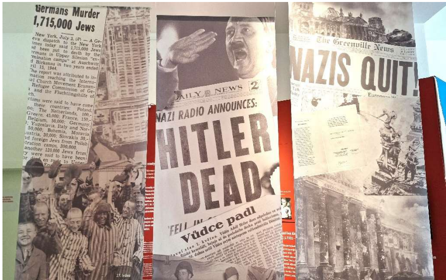
Besuch der Ausstellung Das Jahr 0. Kladno 1945–1946 in Kladno