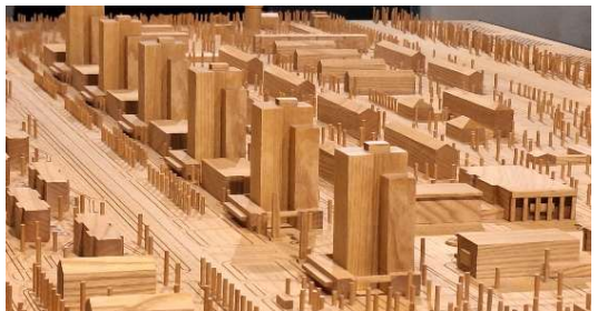
Die Wohntürme im Modell

Das Haus 1, in dem sich heute das Muzeum Věžáků/Hochhausmuseum befindet, wurde Weihnachten 1956 fertiggestellt und beherbergte hauptsächlich Bergarbeiterfamilien. Das Museum zeichnet die Geschichte der Wohnsiedlung Kladno-Rozdělov und der Turmhäuser detailliert nach, von den ersten Skizzen bis zur Fertigstellung. Es beschreibt die Probleme der tschechoslowakischen Bauindustrie in den Nachkriegsjahren und die dramatischen Veränderungen, die das Jahr 1948 mit sich brachte. Und durch die Erinnerungen der ersten Bewohner der Siedlung fängt es auch ein wenig die Atmosphäre der 1950er und 60er Jahre ein. Es ist das erste Museum, das der Wohnsiedlungsarchitektur in der Tschechischen Republik gewidmet ist.