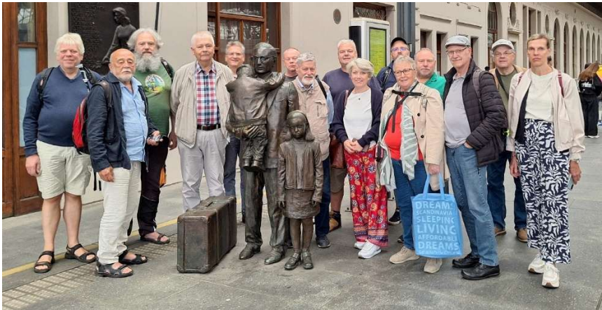
Am Prager Hauptbahnhof ist immer Zeit für einen Besuch bei der Skulptur Sir Nicholas Wintons und den geretteten jüdischen Kindern