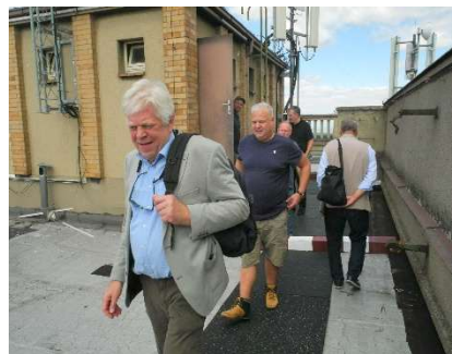
Besichtigung der Dachterrasse

Architekt Josef Havlíček entwarf sechs 13-stöckigen Wohnhäuser aus drei miteinander verbundenen Einheiten (in Form des Buchstabens T). Die Struktur besteht aus Stahlbetonskelett und Füllholz. Die Fassade besteht aus keramischen Materialien. Die Methode der Heizung war auch außergewöhnlich, als das Crittal-System verwendet wurde (Wärmeverteilung in Säulen zusammen mit Heizschlangen in den Böden).