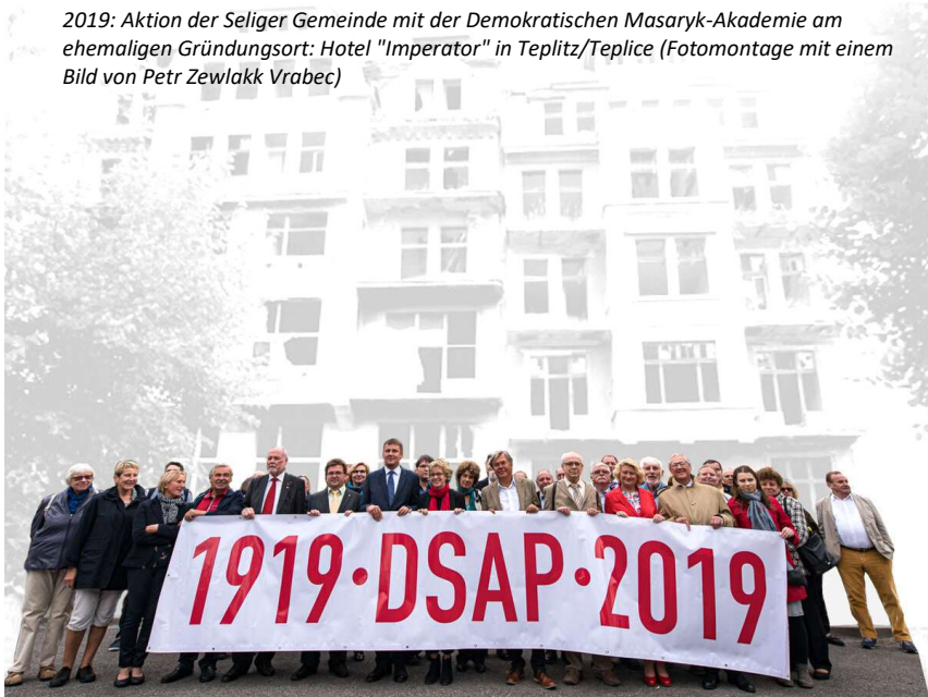
2019: Aktion der Seliger Gemeinde mit der Demokratischen Masaryk-Akademie am ehemaligen Gründungsort: Hotel "Imperator" in Teplitz/Teplice