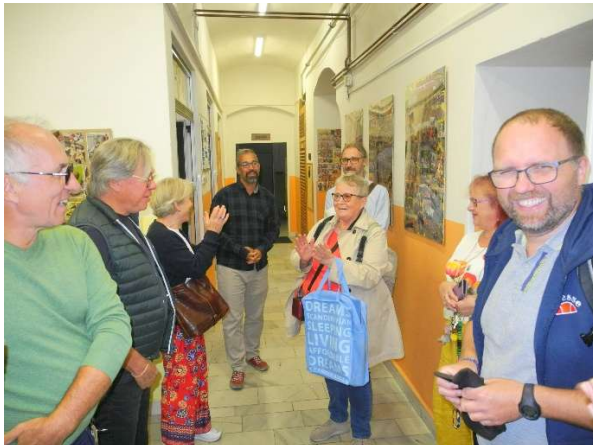
Auch der Spaß durfte bei den interessanten Ausführungen nicht zu kurz kommen

Die vierte Studienfahrt der Seliger-Gemeinde konnte mit finanzieller Unterstützung des Deutsch-Tschechischen Zukunftsfonds , der Ernst und Gisela Paul-Stiftung und in Zusammenarbeit mit der Demokratischen Masaryk-Akademie durchgeführt werden – dafür herzlichen Dank!