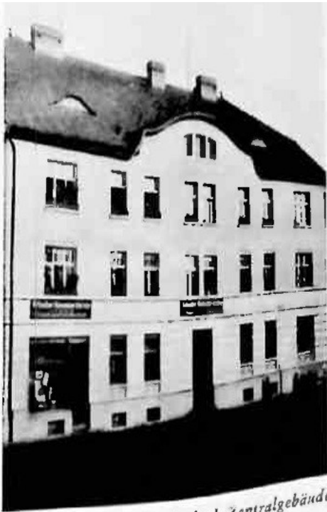
Konsumgenossenschaft Bodenbach, Zentralgebäude

„Jetzt wisst ihr es: In Eurer Stadt gibt es Besonderheiten, an denen man nicht vorbeigehen kann“ stellte Roman Wirkner in seiner Erzählung weiter fest. Und die Exkursionsgruppe folgte seinen Beschreibungen: „Viele von uns wohnten in Genossenschaftsgebäuden, einkaufen gingen wir im Konsum und dem GEC-Warenhaus. Unser tägliches Brot lieferte die Arbeiterbäckerei, die Bücher beschaffte die Volksbuchhandlung, und der „Volksbote“ kam schwarz auf weiß aus der Arbeiterdruckerei“.