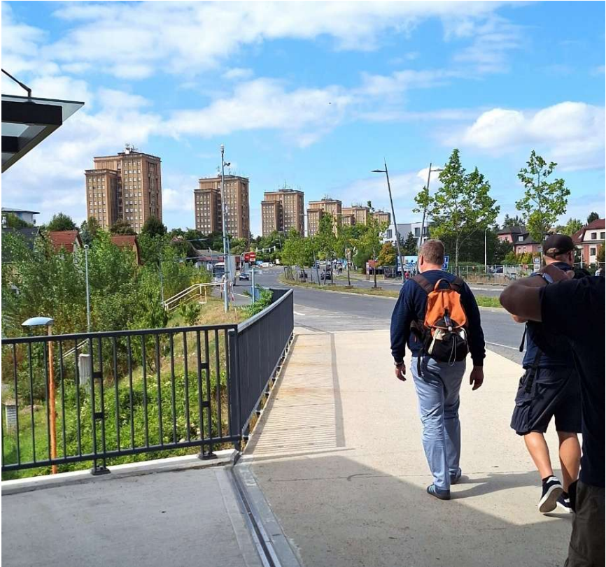
Die sechs dominierenden Hochhäuser, die an die Wolkenkratzer Chicagos erinnern