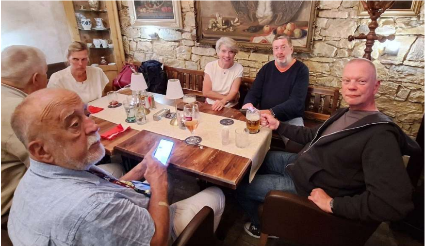
Das Ende der Studienfahrt fand erneut mit einem gemeinsamen Abendessen in der Pizzeria Cihelna La Famiglia im Prager Ortsteil Karlín statt. Eben in jenem Gebäude, in dem die SOPADE, die Sozialdemokratische Partei Deutschlands im Exil, 1933 ihren Sitz hatte.

Über den Sonntag hinaus als offiziellen Rückreisetag nutzten einige Teilnehmer die Möglichkeit noch ein paar Urlaubstage in Prag anzuhängen. Ein interessantes aber auch anstrengendes Wochenende ging viel zu schnell zu Ende.