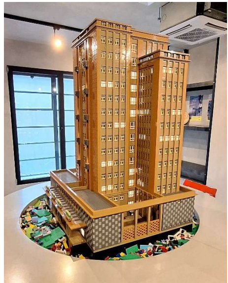
Ein Wohnturm im Original (links) und als LEGO-Modell (oben). In Kladno ist die größte LEGO-Produktionsstätte Europas.