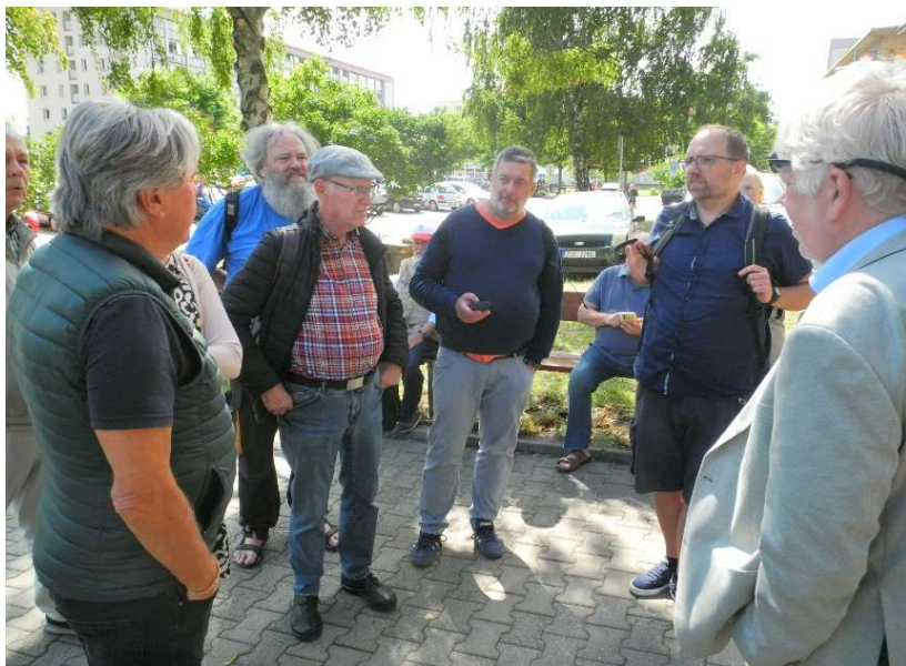
Während unserer Studienfahrt 2025 konnte Organisator Dr. Thomas Oellermann wieder viele Informationen zu den besuchten Orten und angesprochenen Persönlichkeiten beisteuern