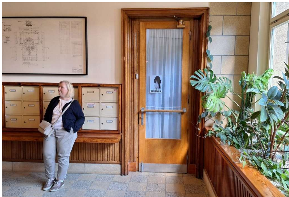
Die Eingangshalle mit Ruhezone, Grünpflanzen und Postkästen