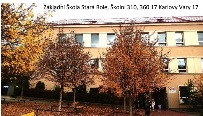
Základní Škola Stará Role, Školní 310, 360 17 Karlovy Vary 17

Die Seliger-Gemeinde wünscht allen Mitgliedern und Freunden eine gesegnete Weihnacht und ein friedliches Jahr 2026!